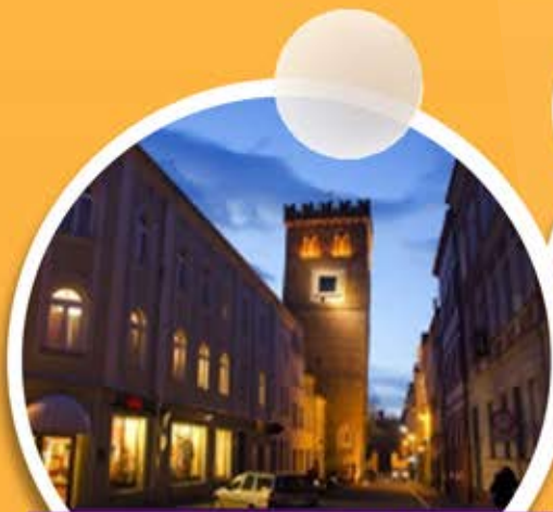
KRZYWA WIERZA LABORATORIUM FRANKENSTEINA